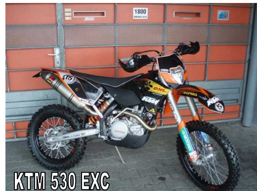
KTM 530 EXC