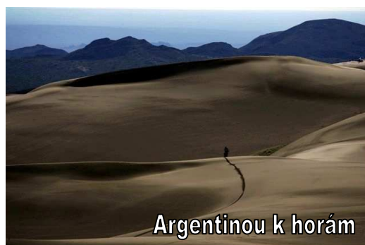
Argentinou k horám

Původně plánovaná zpáteční cesta po území Argentiny nám byla z časových důvodů zapovězena. Město Mendoza, Kordillery ze strany Argentiny a jejich nejvyšší vrchol Aconcaqua 6 960 m jsme na vlastní oči nakonec neviděli. SNAD TEDY PŘÍŠTĚ!