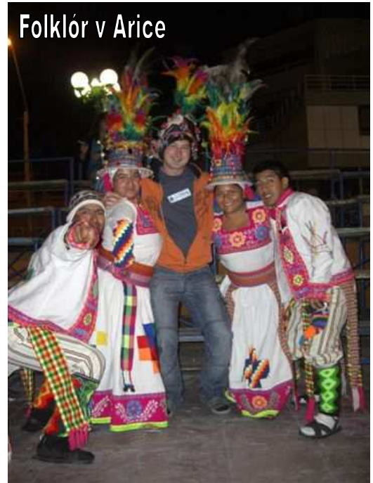
Folklor v Arice