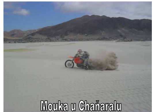
Mouka u Chañaralu

Copiapem, Letovisko u Caldery, bizarní tvary hor v okolí Copiapa a průjezd přímořským národním parkem Pan de Azúcar, jeho barevné hory a sněhobílé dunové pláže u města Chañaral.