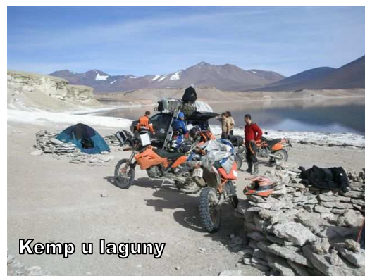
Kemp u laguny

6.1.2010 už v předvečer narůstá nervozita , zítra jedeme společně se závodníky 670 km dlouhou etapou z Copiapa do Antofagasty. Cesta pouští Atacama je nekonečná, každý z nás si vybírá nějaký ten pád, který končí našťastí pouze pohmožděninami.