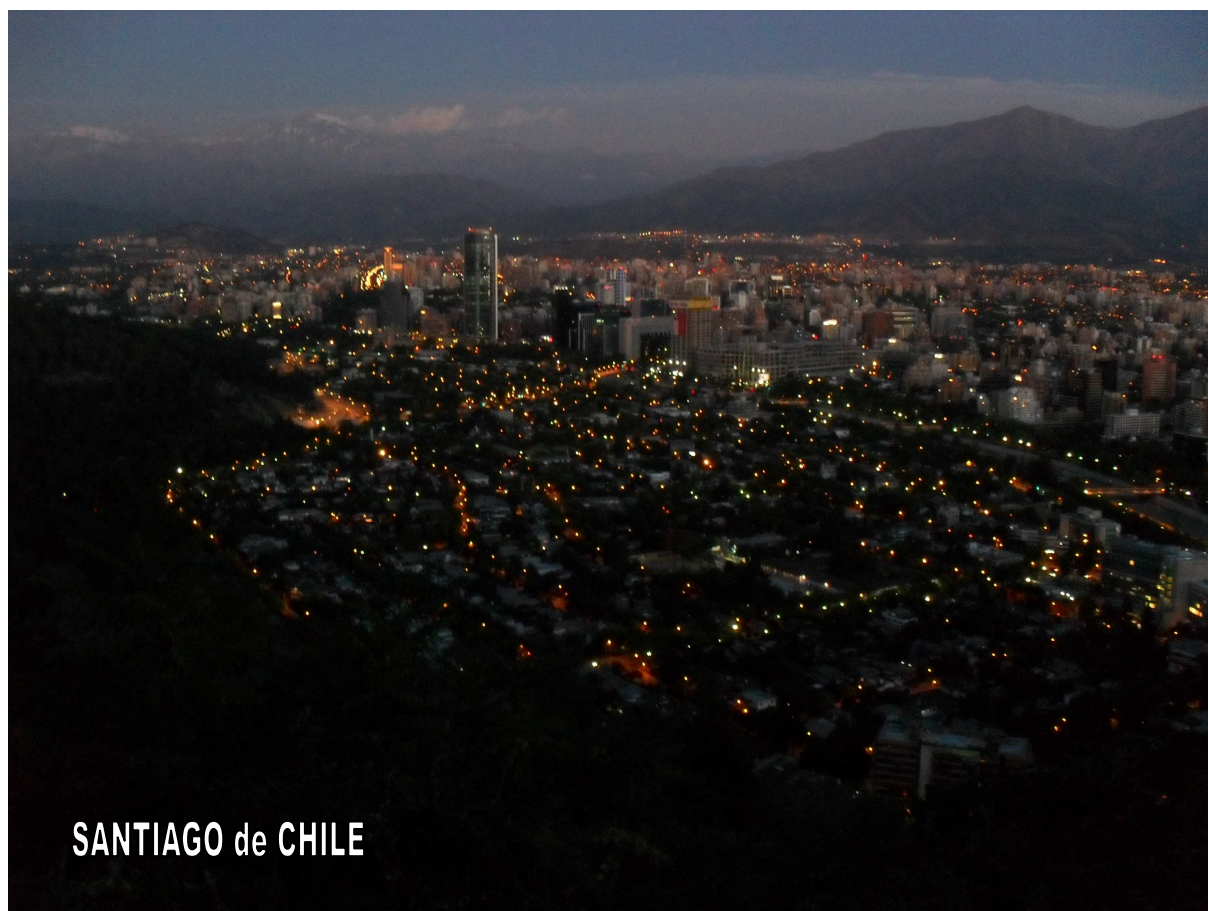
SANTIAGO de CHILE