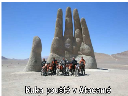
Ruka pouště v Atacamě

Naše cesta končí po dalších třech etapách 18.11. 2010 opět v Santiagu. Při závěrečném přesunu do Santiaga stojí za zmínku známý monument „RUKA POUŠTĚ“ uprostřed pouště Atacama na půl cesty mezi městy Antofagastou a