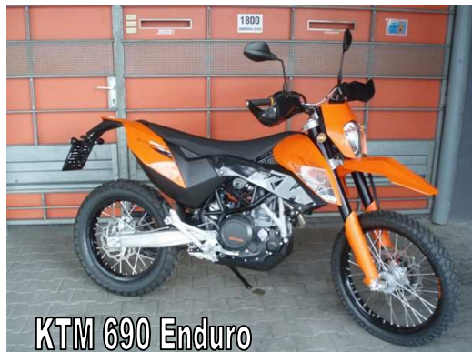
KTM 690 Enduro